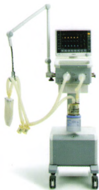
SynoVent E5 呼吸机