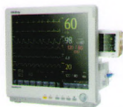
BeneView T8 病人监护仪

独特的内置CIS功能，全方位的临床设备信息、多科室的数据整合，内置麻醉科/ICU专业电子病历系统，更多信息尽览无余。