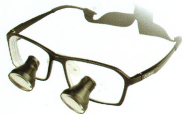
SLT嵌入式定制放大镜