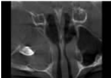
图1 CBCT扫描示18位于上颌窦内埋伏阻生上颌窦密度增高影

右上颌第三磨牙埋伏阻生比较多见,但阻生在上颌窦内极其罕见。本病例可能在胚胎发育的时候,其右上颌第三磨牙的恒牙胚就存在于上颌窦内,或者由于某些原因,上颌骨内埋伏阻生的第三磨牙进入到上颌窦内;上颌窦与上颌磨牙根尖的解剖关系密切,上颌窦的下壁由前向后盖过上颌第二前磨牙至第三磨牙的根尖,与上述牙根尖之间隔以较薄的骨质,或无骨质而仅覆以黏膜,其中以上颌第一磨牙近中颊侧根尖距上颌窦下壁最近。当上颌窦内有慢性炎症时,分泌物易穿透上颌窦下壁较薄的骨质或黏膜而形成窦道,排泄至口腔内,本病例中的患者即属于这种情况。