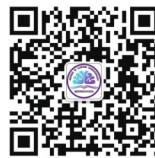
移动稿件处理 《临床神经外科杂志》服务号