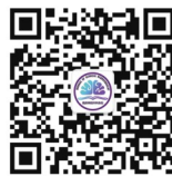
本刊动态资讯 《临床神经外科杂志》订阅号