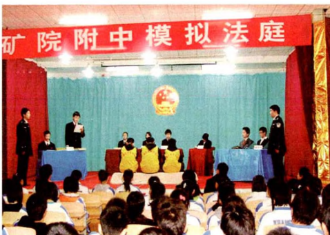
矿院附中开展的“检察官进课堂”和“模拟法庭”活动，使学生们从小就立志做一个守法的好公民。