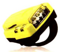
MiniMax XP 便携式气体检测仪 智能逃生报警手环Evacuaid