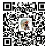
当好守夜人 筑牢安全线 ——人民日报专访应急管理部党组书记黄明