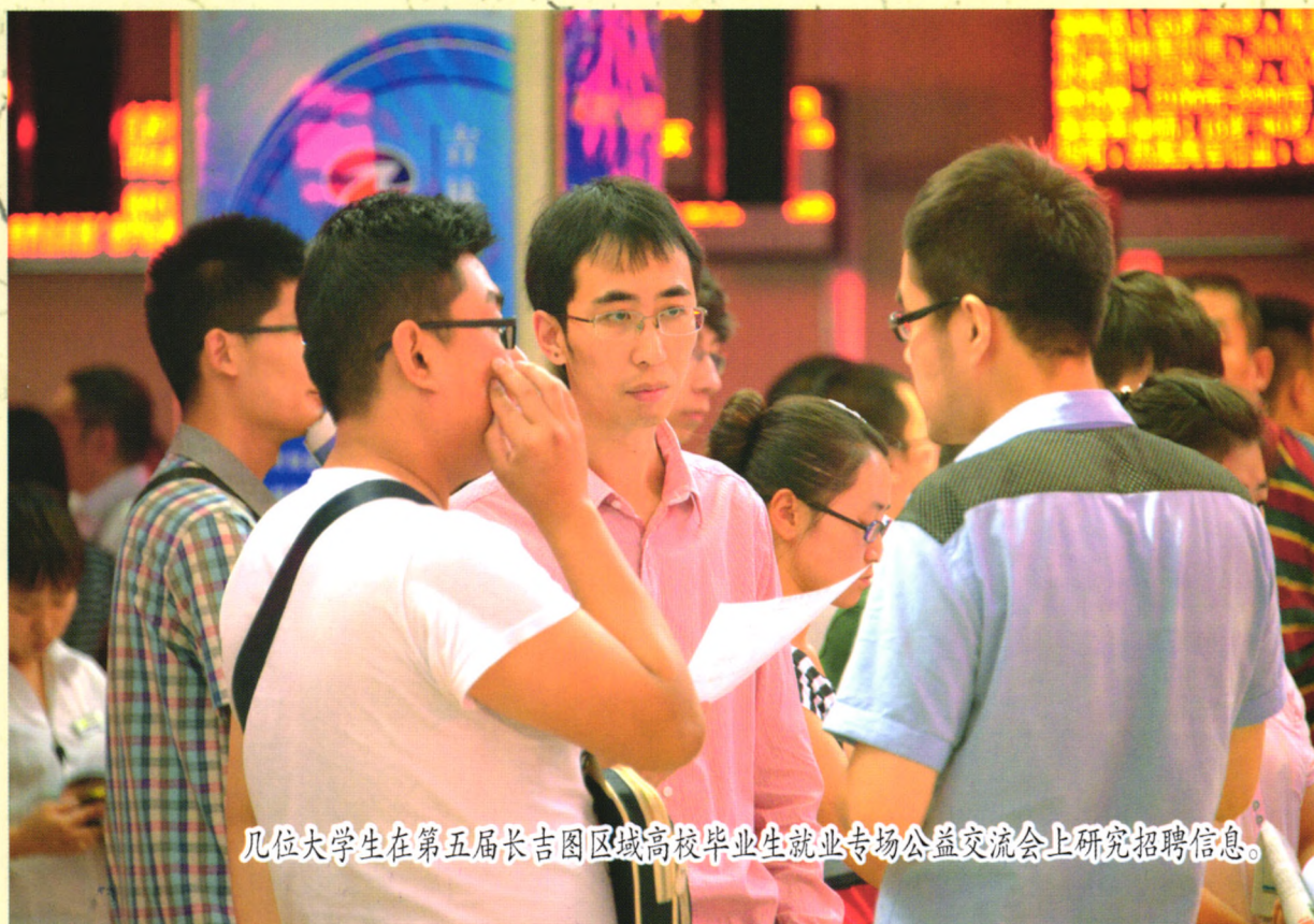
几位大学生在第五届长吉图区域高校毕业生就业专场公益交流会上研究招聘信息。

就业有门路 创业有政策 聚焦吉林省就业创业体制机制改革 大学生月薪期望值持续下跌的背后 事业单位养老改革还差什么？ 城乡养老保险改革路有多艰？ 一则微信“诉苦”引发的离职纠纷