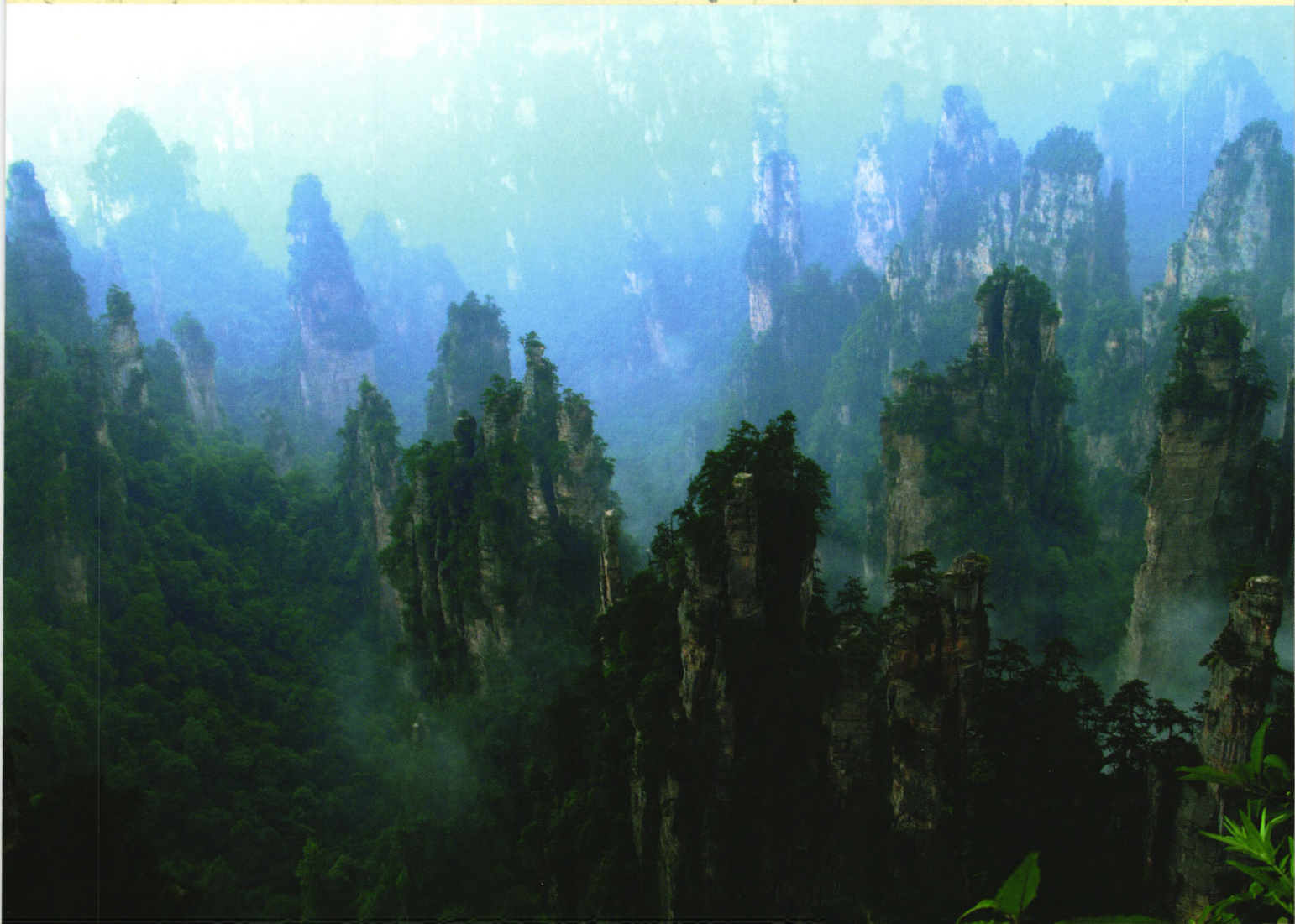
张家界之天子峰