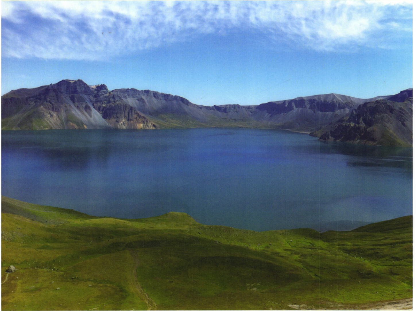
天池美景