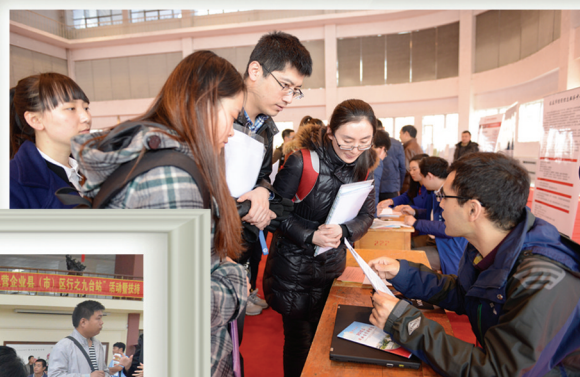
长春市人才政策宣传走进大学校园