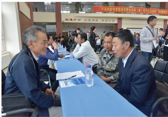
长春市深入开展“千名科技专家服务民营企业”活动，把好政策送到基层