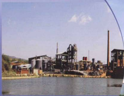
云南常青树化工有限公司10万吨/年磷酸、20万吨/年粉状MAP、10万吨/年DAP全套交钥匙工程

★云南中瀛化工有限公司9万吨/年磷酸、6万吨/年粉状MAP、12万吨/年粉状DAP全套交钥匙工程正在施工中，2011年8月可望交付使用。