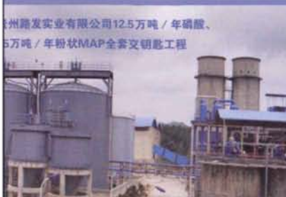
贵州路发实业有限公司12.5万吨/年磷酸、5万吨/年粉状MAP全套交钥匙工程