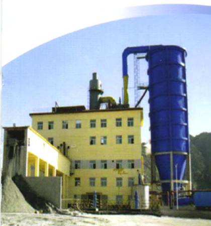
青海创新矿业有限公司50kt/a磷酸、100kt/a粉状MAP全套交钥匙工程

多年来一直致力于磷肥成套装置的研究、设计、制造、安装、调试及开车，为国内外磷肥企业提供了过滤机、搅拌桨等专用设备，是中国磷化工设备制造骨干企业。