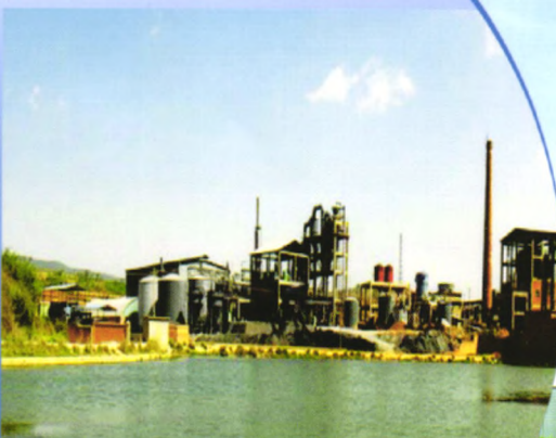
云南常青树化工有限公司100kt/a磷酸、200kt/a粉状MAP、100kt/aDAP全套交钥匙工程

地址：江苏省兴化市戴南科技园区 邮编：225721 电话：0523-8378 1169 8378 7008 传真：0523-8378 1911 网址：www.chinanhd.com 电邮：nhd@chinanhd.com