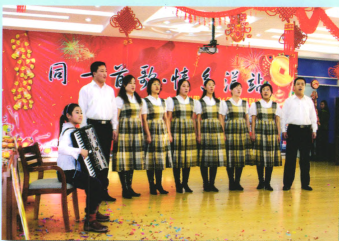
▲ 自编自演的文艺节目