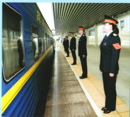
▲ 国际旅客列车进站