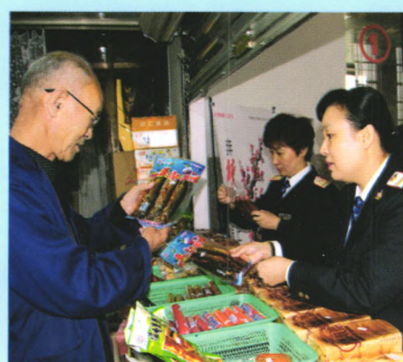
▲ 严格检查候车室售货食品质量