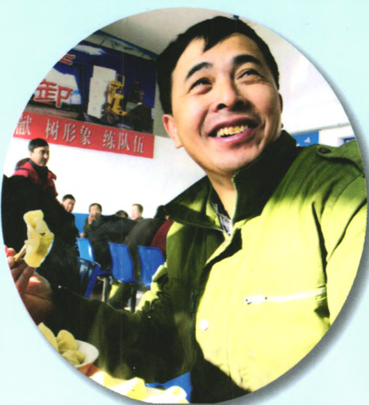
▲ 忙班职工吃上热饭