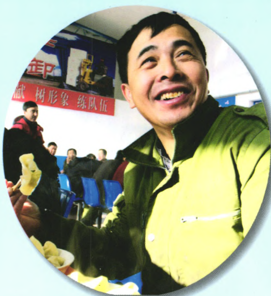
▲ 忙班职工吃上热饭