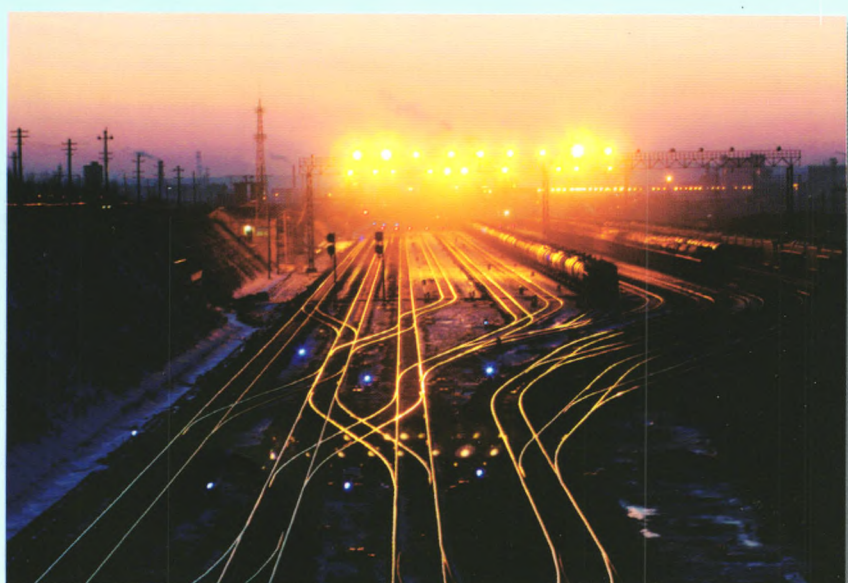
▲ 满洲里站准轨东场