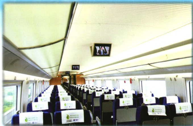
▲ 动车组视频及头枕片广告