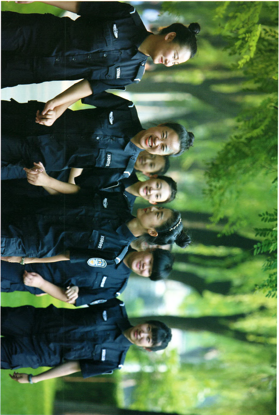
放飞梦想 辽宁公安司法管理干部学院 张扬摄

主管单位:辽宁省公安厅 主办单位:辽宁公安司法管理干部学院 编辑出版:本刊编辑部 主 编:赵华明