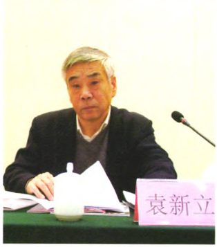
中国老年大学协会常务副会长袁新立出席会议并讲话