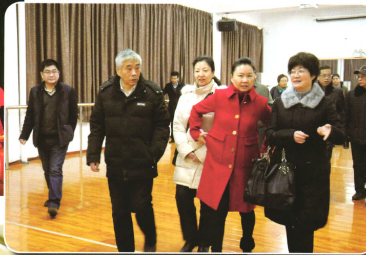
与会代表参观马鞍山市老年大学