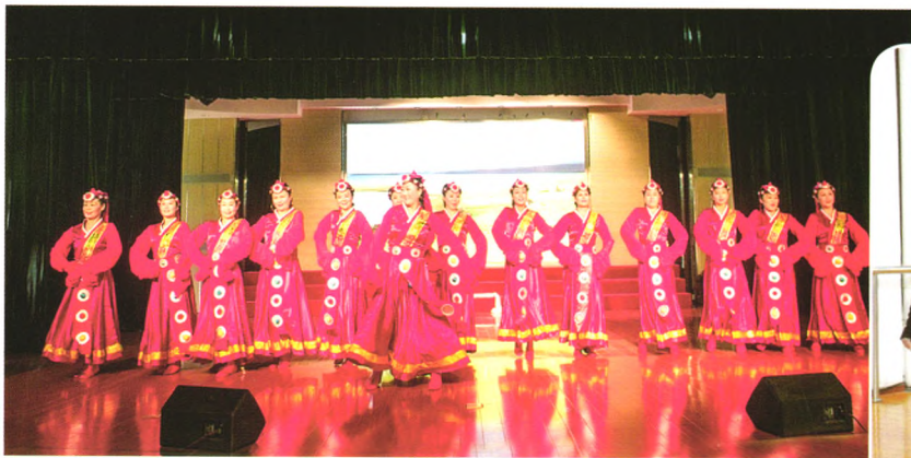
马鞍山市老年大学精彩的文艺演出