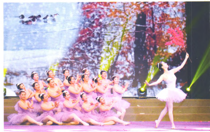
老年大学芭蕾舞班学员表演《我爱你塞北的雪》