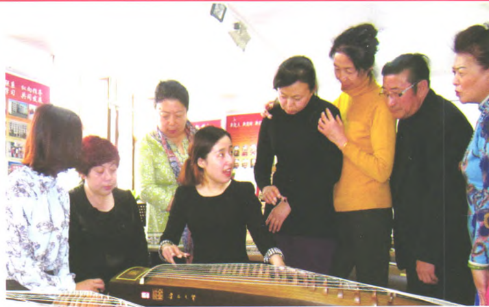
古筝班教师为学员耐心辅导