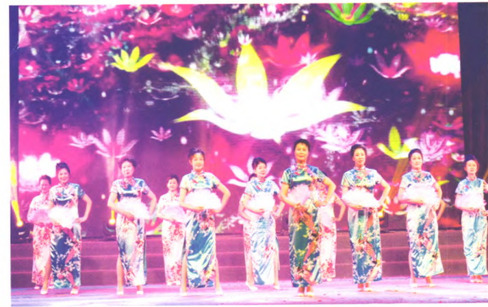
老年大学时装队表演《女人花》