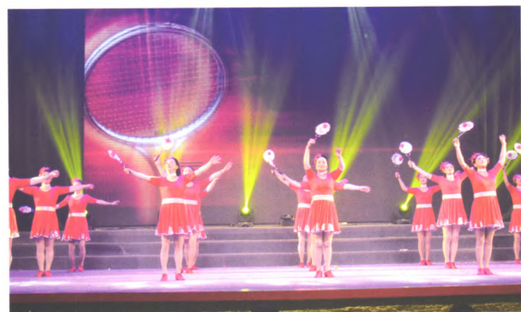
老年大学柔力球班表演《走向复兴》