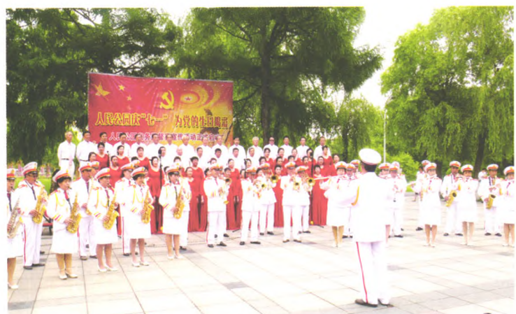
老年大学管乐团演奏《歌唱祖国》