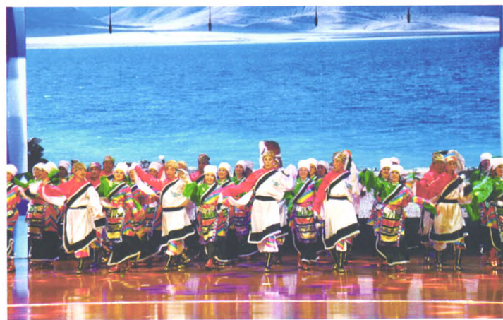
老年大学艺术团舞蹈队表演舞蹈《纳木错》