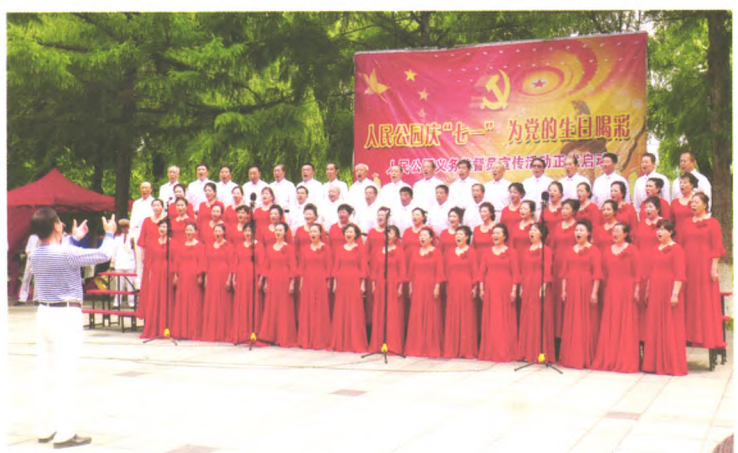
老年大学合唱团在公园演出