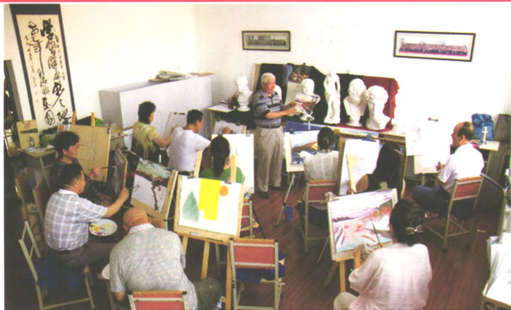
油画班学员在上课