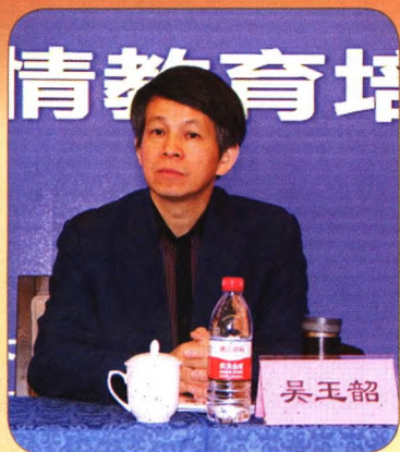
全国老龄办党组成员、中国老龄协会副会长吴玉韶出席会议并做专题讲座