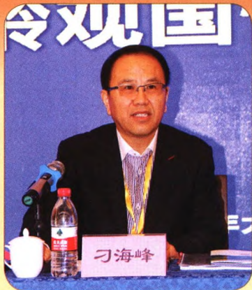
中国老年大学协会常务副会长刁海峰出席会议并讲话