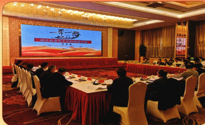
湖北省老年大学课题组参加一带一路与老年教育研究专题研讨会