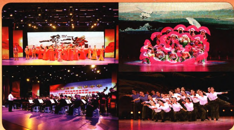
湖北离退休干部改革开放40周年文艺演出精彩纷呈