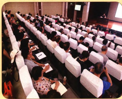
湖北省老年大学公共课火爆，教室座无虚席