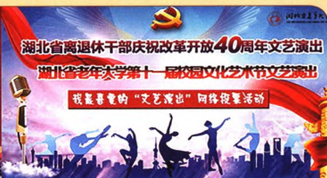
我最喜爱的“文艺演出”网络投票评比活动（注：点击每个作品的画面，即可观看视频）