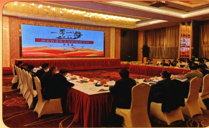
湖北省老年大学课题组参加一带一路与老年教育研究专题研讨会