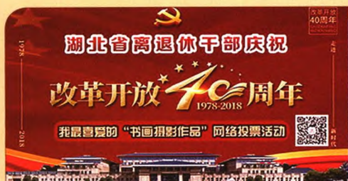
湖北省离退休干部庆祝改革开放40周年——我最喜爱的“书画摄影作品”网络投票活动