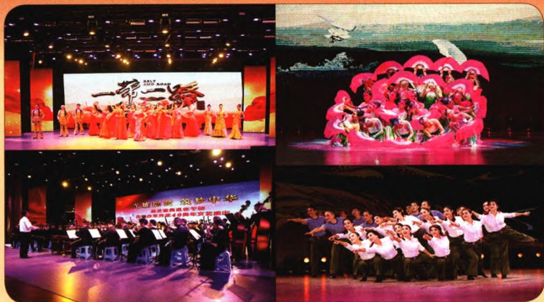
湖北离退休干部改革开放40周年文艺演出精彩纷呈