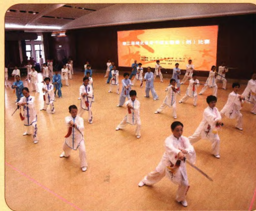
湖北省离退休干部太极拳（剑）比赛 在湖北省老年大学举办