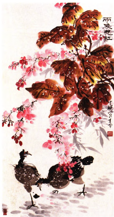
内蒙古老年大学 中麟