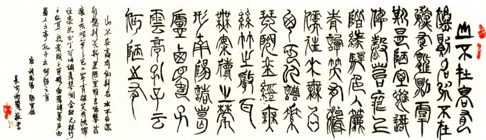
陕西老年大学 雨荷