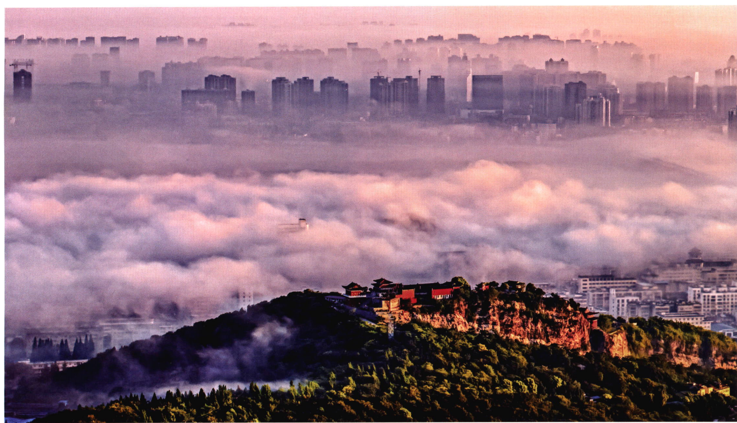
《雾美真武山》 孙峰涛