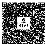
扫描二维码 邮政商城