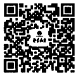
扫描二维码 关注《老年教育》