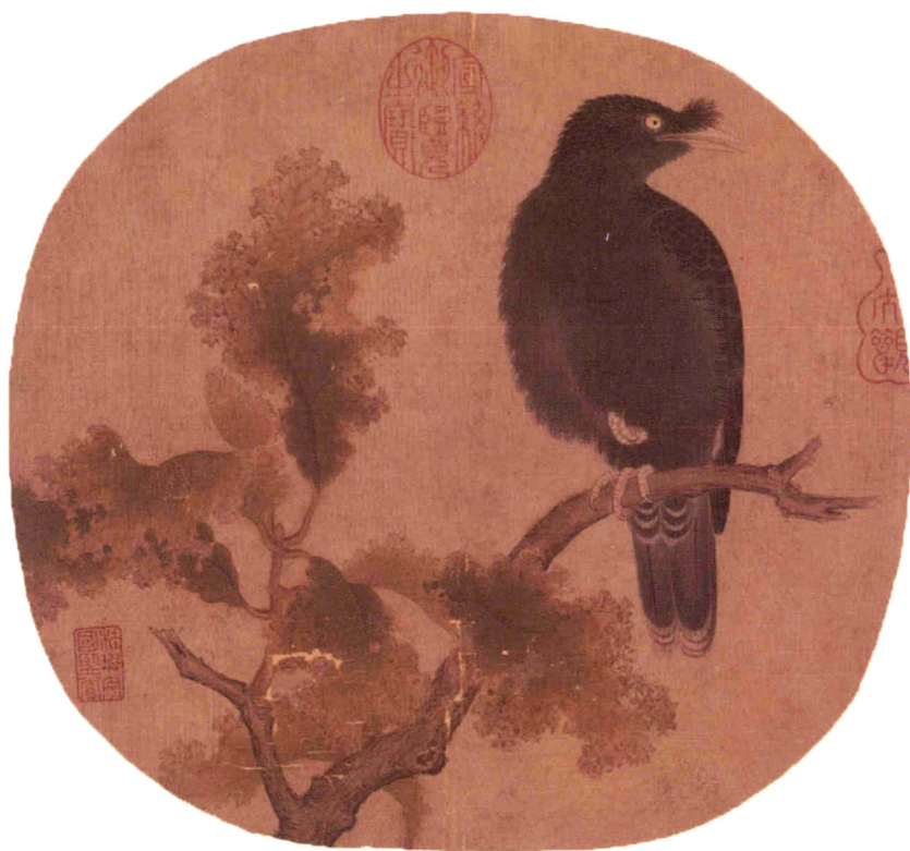
《秋树鸪鸽图》宋·佚名 绢本设色 25cm×26.5cm 北京故宫博物院藏

本幅无款识，鉴藏印钤“大观”葫芦形朱文印、“桂坡安国鉴赏”，及“宣统御览之宝”朱文印。此图存《纨扇画》册中，曾经《石渠宝笈初编》著录。