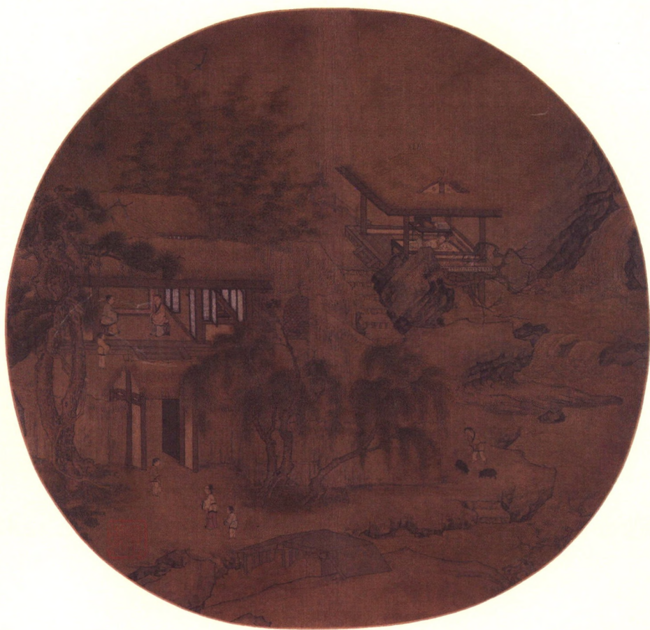
《草堂客话图》页 南宋·何筌