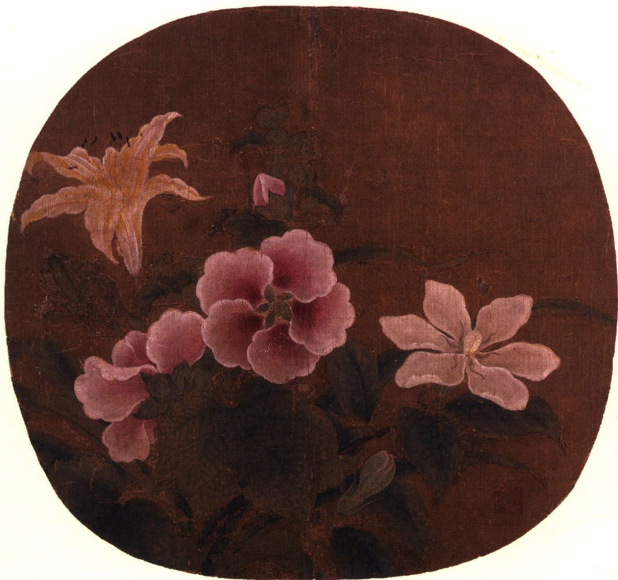
《夏卉骈芳图》南宋·鲁宗贵 绢本设色 纨扇