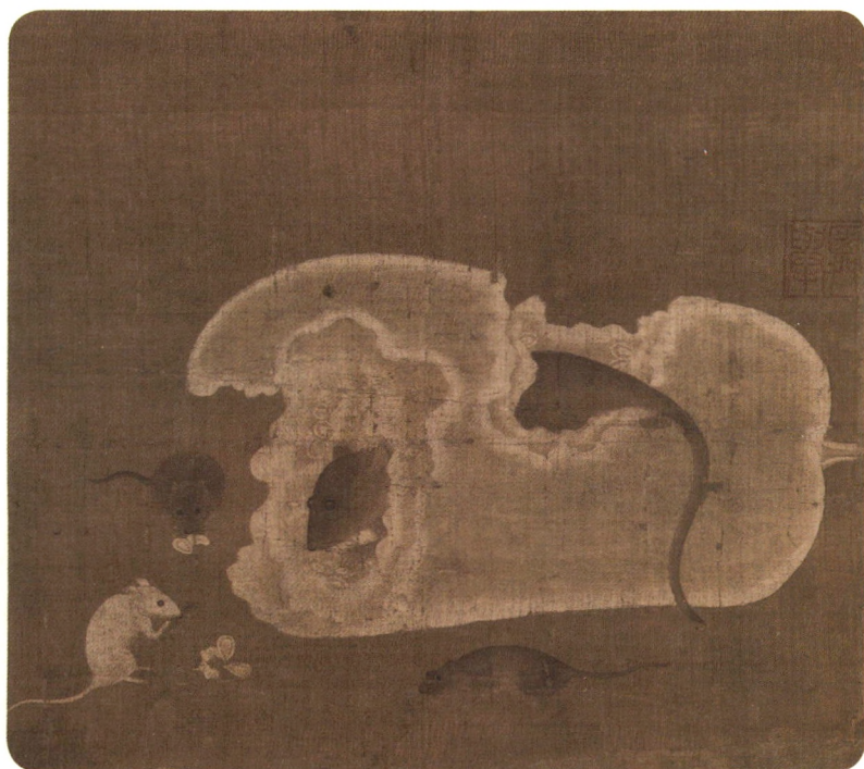
《鼠戏图》元·钱选 纸本设色 24.3cm×27.3cm