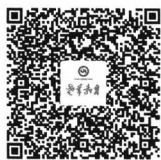
扫描二维码 订阅《老年教育》