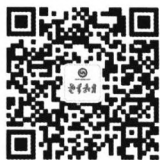
扫描二维码 关注《老年教育》