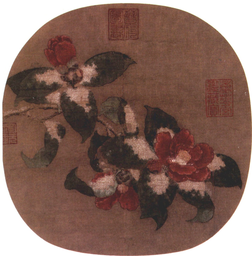
《山茶霁雪图》南宋·林椿 绢本设色 24.8cm×24.8cm

林椿，生卒年不详，钱塘（今浙江杭州）人，南宋孝宗淳熙（1174—1189）时为画院待诏。由于其画艺高超，故受赐金带。其所绘，以花鸟、果品、草虫小品为多。他注重观察自然和实地写生，画法远师赵昌，近取李迪。时人赞其“极写生之妙，莺飞欲起，宛然欲活”。