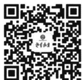
扫描二维码 关注《老年教育》