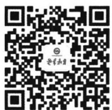
扫描二维码 关注《老年教育》