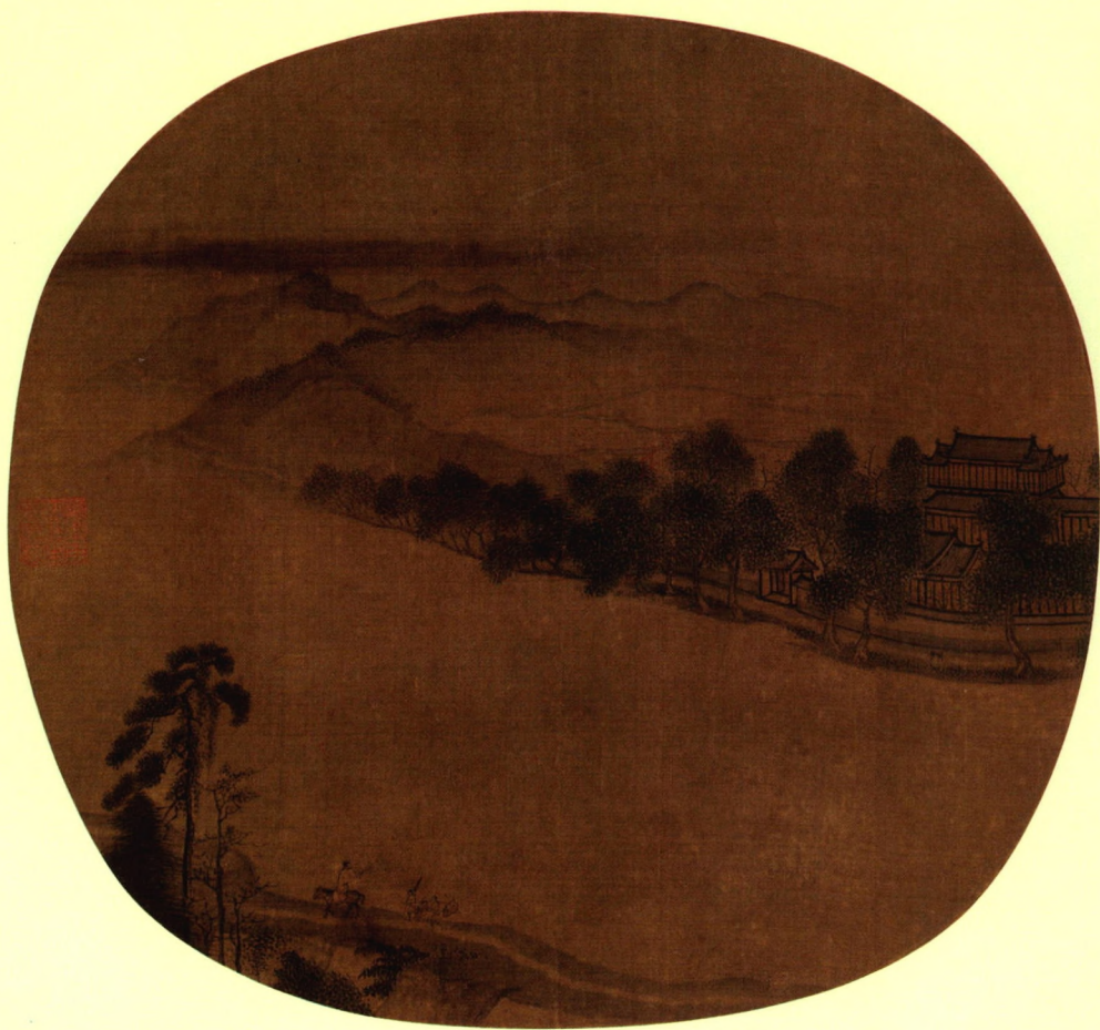
《湖山春晓图》南宋·陈清波 绢本设色 25cm×26.7cm 北京故宫博物院藏

陈清波，生卒年不详，南宋画家，钱塘（今浙江杭州）人。宋理宗宝祐（1253—1258）时为画院待诏。其擅山水，多作西湖全景，风致典雅，笔墨嫣润，传世作品有《湖山春晓图》《瑶台步月图》。