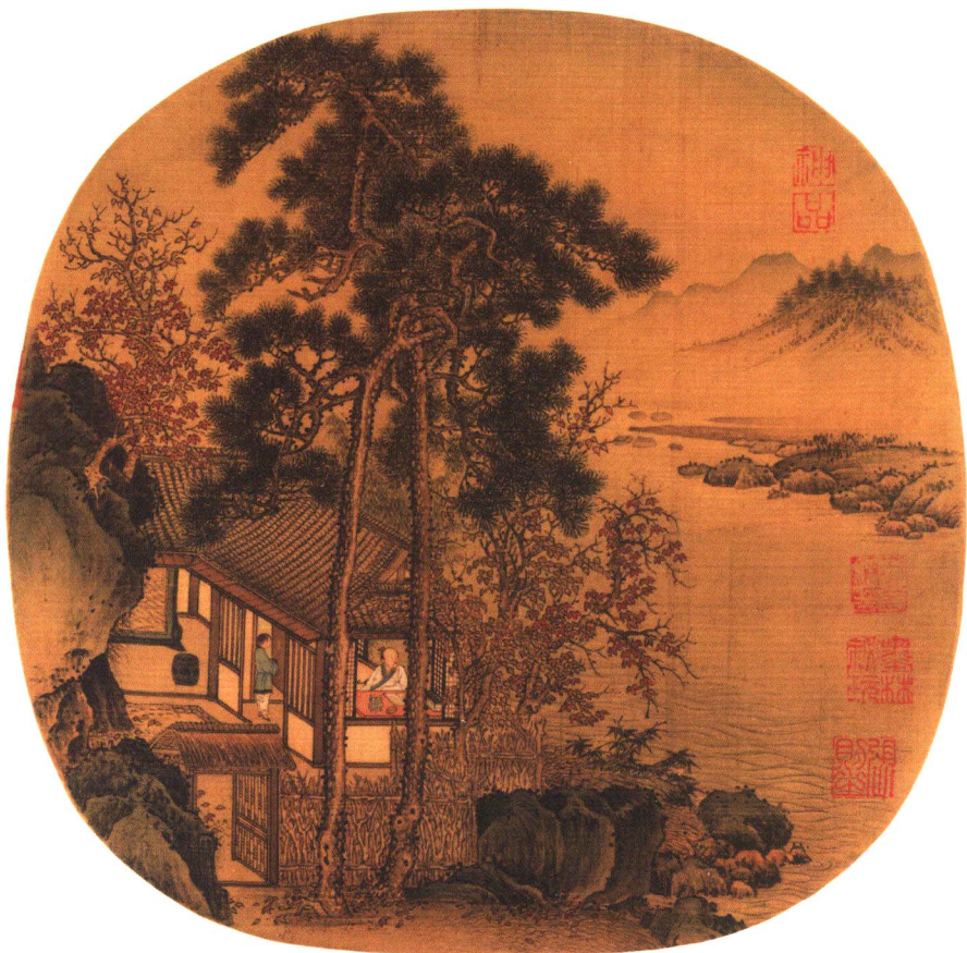
《秋窗读书图》南宋·刘松年 绢本设色 25.8cm×26cm 北京故宫博物院藏

刘松年，浙江杭州人，为南宋孝、光、宁宗三朝宫廷画家，南宋四大家之一。其画风与李唐一脉相承，擅把人物与山水巧妙结合，神气精绝。