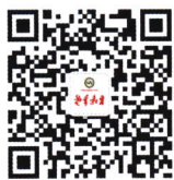
扫描二维码 关注《老年教育》