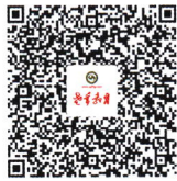
扫描二维码 邮政商城