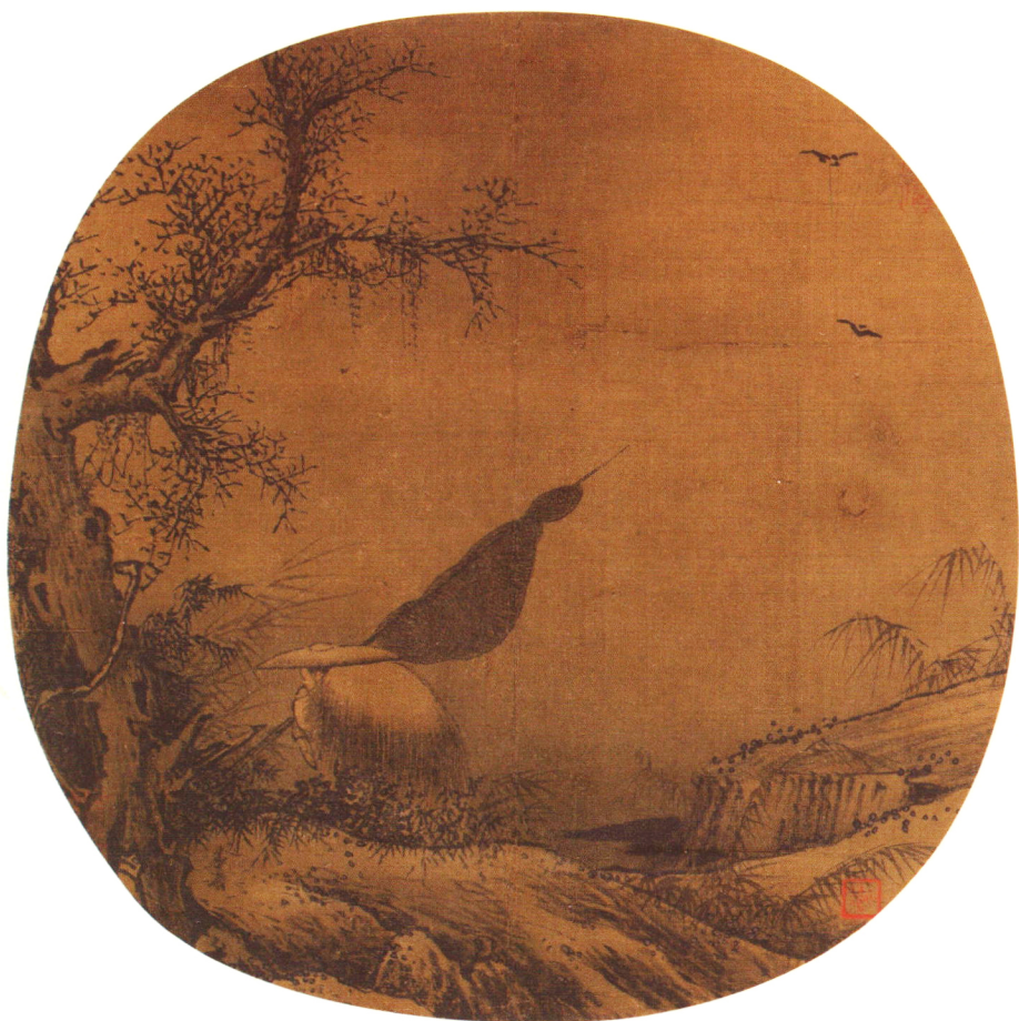
《戴雪归渔图》南宋·梁楷 绢本水墨 23.6cm × 24.7cm 美国华盛顿弗利尔博物馆藏

梁楷，生于1150年，祖籍东平（今山东东平），后流寓钱塘（今浙江杭州），曾为南宋宁宗时画院待诏。他善画山水、佛道、鬼神，传世作品具有两种截然不同的风格，一种为“细笔”，取法吴道子、李公麟，师从贾师古，为密体法；一种为“减笔”，继承五代石恪的简括之法，以寥寥数笔横扫，对后世写意画的发展影响深远。