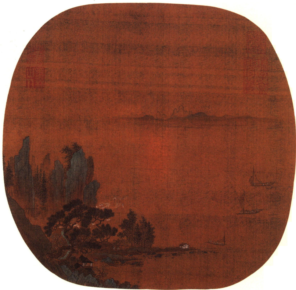
《澄江碧岫图》南宋·佚名 绢本设色