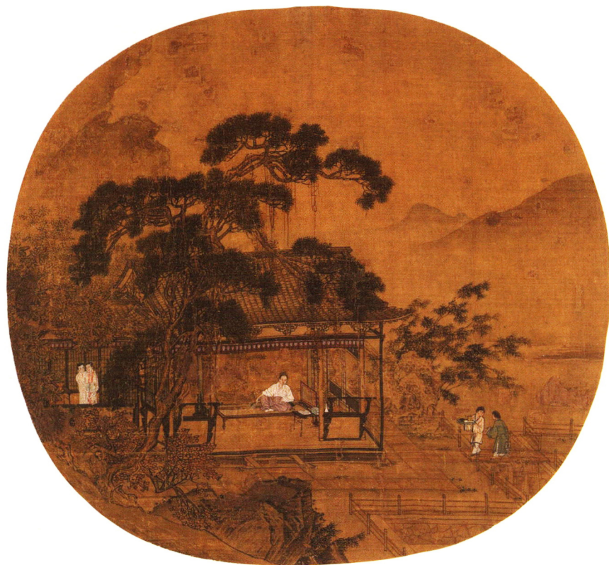
《风檐展卷图》南宋·赵伯骕 绢本设色