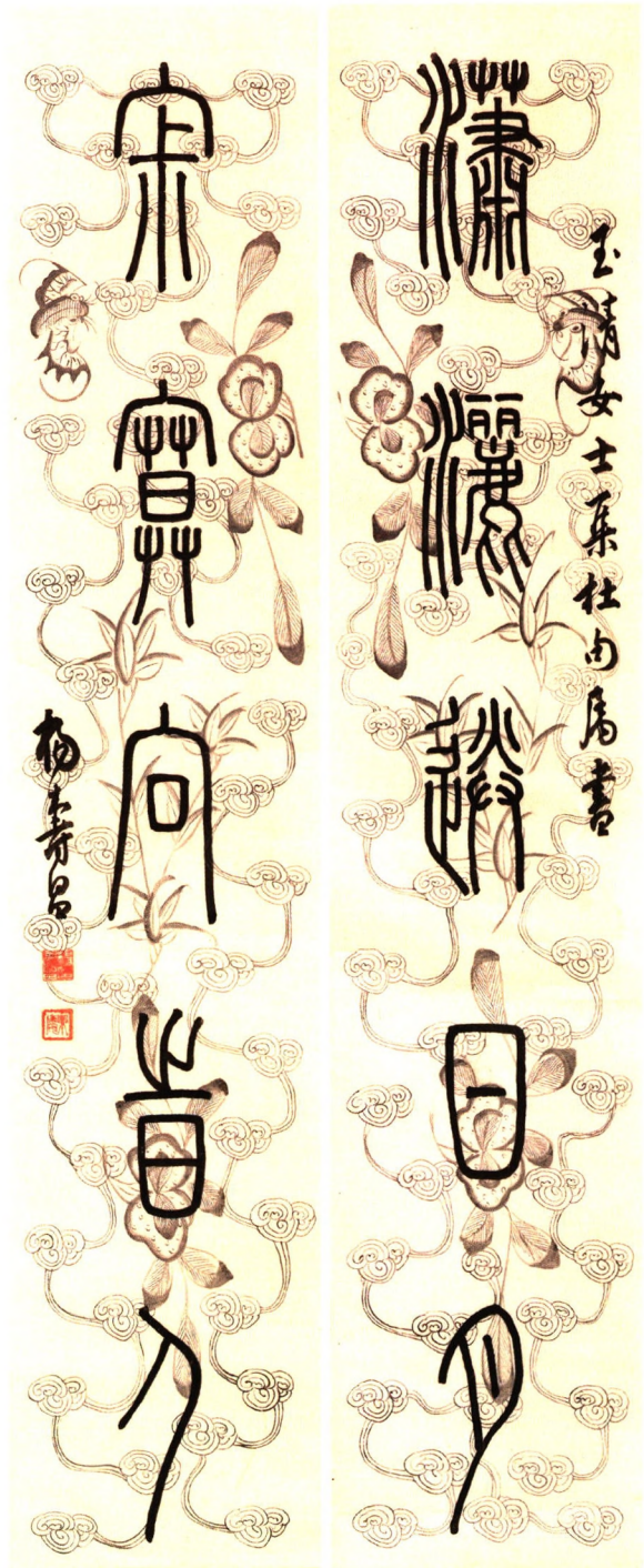
杨寿昌书法（广东省文史研究馆藏）