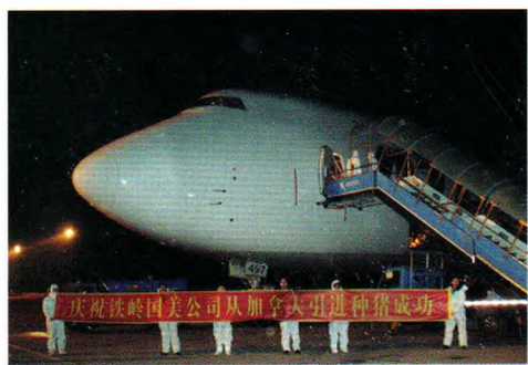
引种抵达沈阳桃仙机场

公司将以崭新的形象，拼搏的精神，争创东北健康绿色养殖行业龙头企业。公司以良好的信誉，先进的技术，打造名牌企业，服务东北，辐射全国。