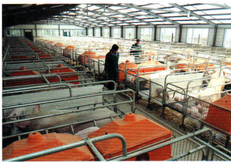
国美智能化养殖公司猪舍