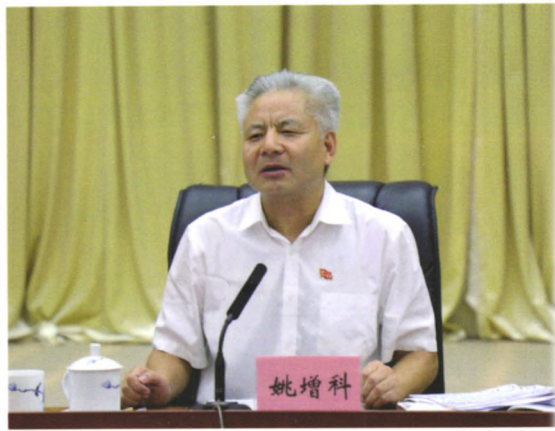
江西省委副书记姚增科