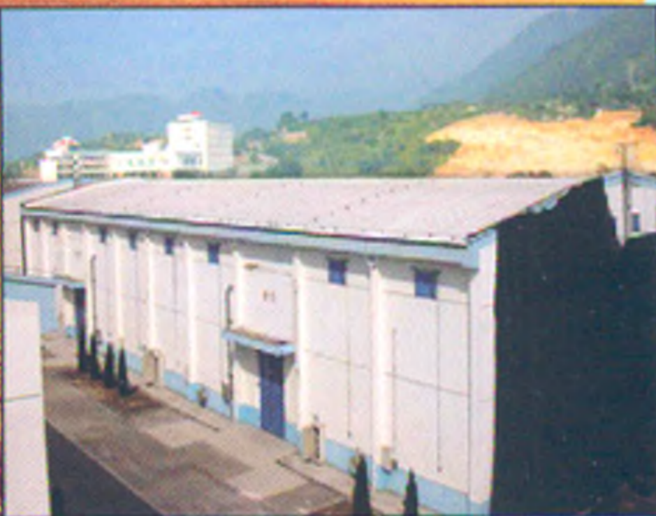
菱镁产品屋面保温隔热工程