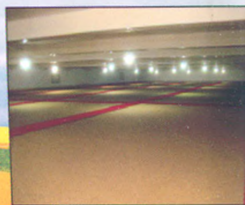
菱镁产品吊顶工程