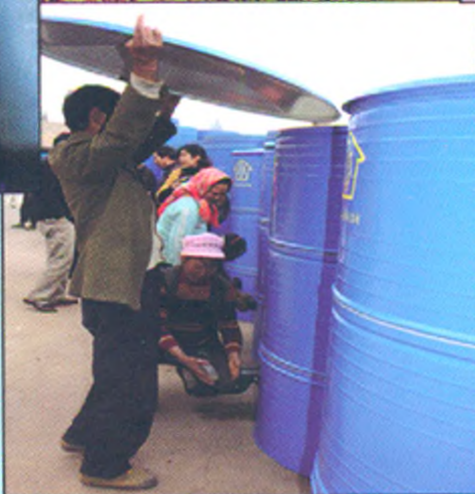
农户科学储粮示范仓