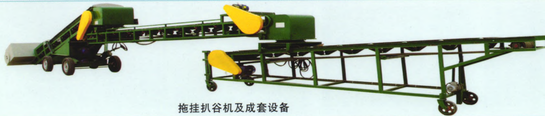
拖挂扒谷机及成套设备