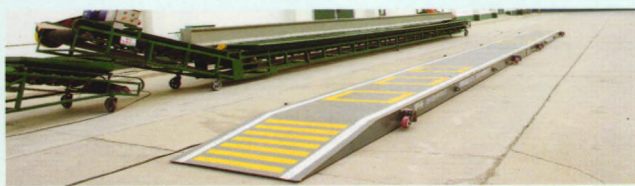
单边桥、除尘卸粮机