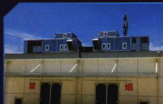
成品粮低温库案例