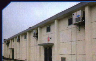
粮食顶层降温空调案例