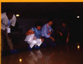
非洲友人进仓参观