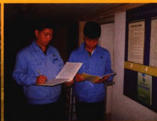
“二牌三簿”规范化管理