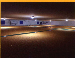
储备粮规划化管理