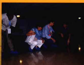
非洲友人进仓参观