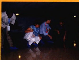
非洲友人进仓参观