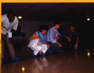
非洲友人进仓参观