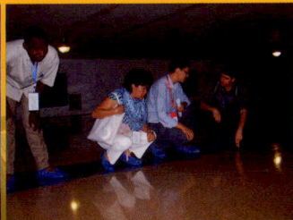
非洲友人进仓参观