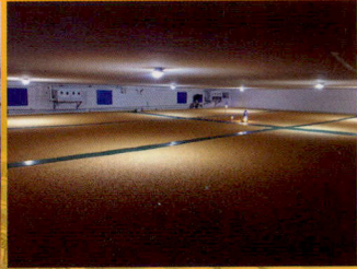
储备粮规范化管理