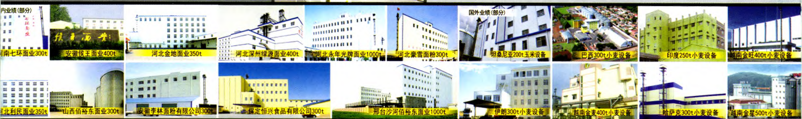
内业绩(部分): 河南七环面粉业300t, 安徽侯王面粉业400t, 河北金地面粉业350t, 河北深州绿源面粉业400t, 河北永年光牌面粉业1000t, 河北蒙雷面粉300t, 山东利民面粉业350t, 山西信裕东面粉业300t, 安徽李林面粉有限公司300t, 保定恒兴食品有限公司300t, 邢台沙河佰裕东面粉业1000t, 河南金星500t小麦设备, 国外业绩(部分): 坦桑尼亚200t玉米设备, 巴西300t小麦设备, 印度250t小麦设备, 伊朗300t小麦设备, 越南金星400t小麦设备, 精萨克300t小麦设备, 越南金星500t小麦设备