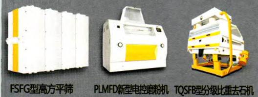
FSFG型高方平筛 PLMFD新型电控磨粉机 TQSF型分级比重去石机