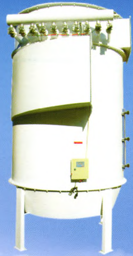
高压脉冲布袋除尘器