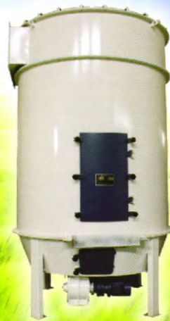
低压脉冲布袋除尘器