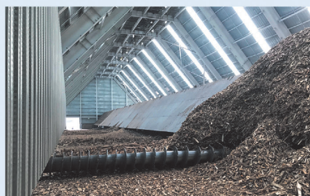
大容量封闭式行走螺旋料仓系统